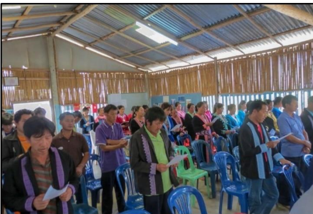
PHUHIRONGKLA GEMEINDE IN THAILAND.