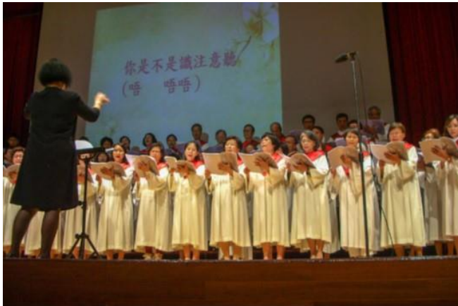
EIN CHOR FEIERT DAS 60JÄHRIGE JUBILÄUM DER GEMEINSCHAFT MENNONITISCHER GEMEINDEN IN TAIWAN.