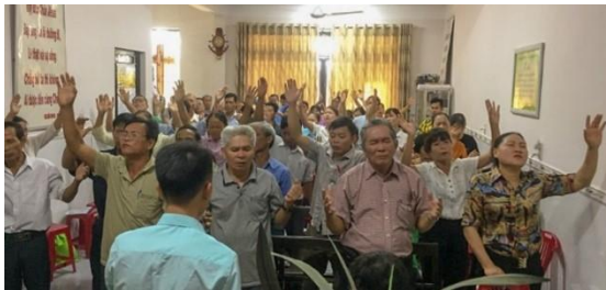
HOI THANH MENNONITE CHURCH