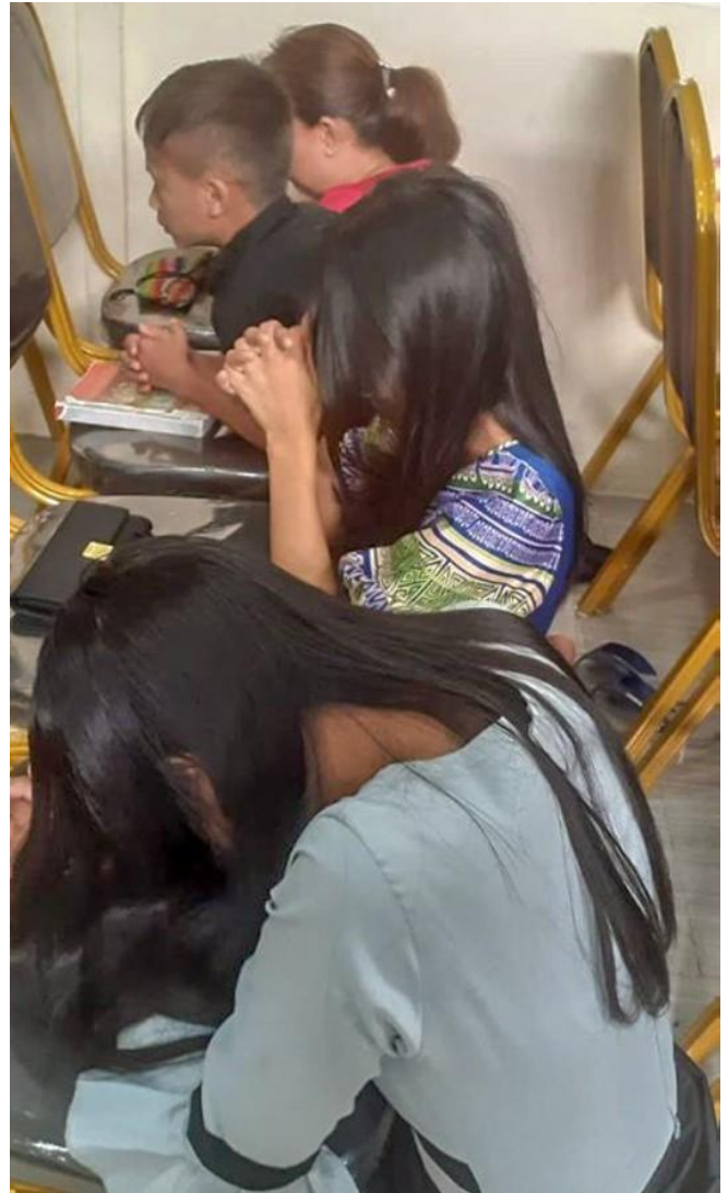
GEBETSGOTTESDIENST AM 1. JANUAR 2020 IN DER BIBLE MISSIONARY CHURCH, MYANMAR.

Viele asiatische Gemeinden beten es regelmäßig