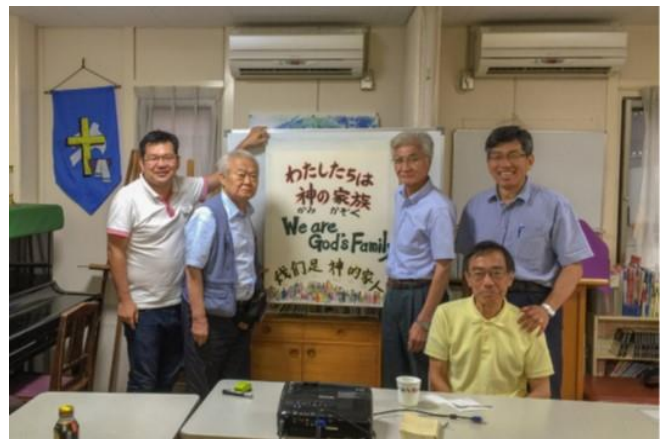
YAYOIDAI BROTHERS IN CHRIST GEMEINDE IN JAPAN.

Amita Sidh, Mennonitengemeinde Rajnandgaon, Mennonitische Kirche Indien