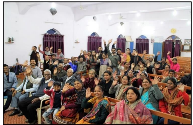
DIE GEMEINDE VON RAJNANDGAON GRÜßT DIE MWC FAMILIE.