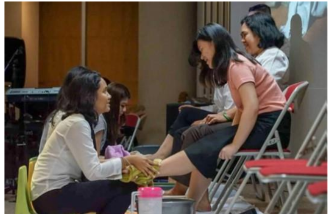
FÜßWASCHUNGSGOTTESDIENST BEI GKMI ANUGERAH RAYON KEMBANGAN, JAKARTA, INDONESIA.

Welche Art von Spiritualität kann uns über Grenzen schieben, so dass Einheit und Fürsorge sich verwirklichen lassen? Die Antwort darauf gibt Paulus in den folgenden Versen: Wir fokussieren unsere Gedanken und Gefühle auf Jesus Christus (2:5). Wir folgen Jesus nicht nur indem wir tun was er tat, sondern indem wir die gleiche Einstellung haben wie Christus. Es geht darum sich zu „entäußern“ wie Jesus (2:6-7). „Entäußern“ kann bedeuten: aufgeben oder niederlegen was man besitzt, sich selbst weniger wichtig nehmen. Dies wird klar wenn man sieht, dass Jesus seine Herrlichkeit aufgegeben hat, um ein Diener zu werden.