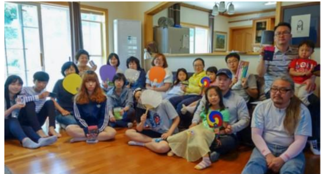
DIE JESUS VILLAGE CHURCH IN SÜDKOREA BEREITET IHRE AUSSTELLUNG FÜR DAS GLOBAL VILLAGE BEI DER 16. VERSAMMLUNG DER MWC IN HARRISBURG, PENNSYLVANIA, USA VOR.

Gottes Wohnung, ganz in der Nähe des Jakobsbrunnens. Jesus antwortet, dass eine Zeit kommt, wo man weder in Jerusalem noch auf dem Berg der Samaritaner anbeten wird. Jesus sagt, dass wahre Anbetung Gottes im Geist und in der Wahrheit geschehen wird, und nicht an einem bestimmten Ort. Jesus konzentriert sich auf die Menschen, die anbeten und nicht auf den Ort der Anbetung.