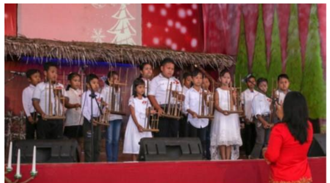
KINDERCHOR DER GITJ KELET, INDONESIEN.

Bei GITJ arbeiten wir auch an guten Beziehungen mit den Kollegen der Sufi und des schiitischen Islams, bei denen es sich um kleinere Gruppen innerhalb der muslimischen Gemeinschaft handelt. Einige Male haben wir Freizeiten für junge Leute verschiedener Religionen abgehalten, um Freundschaften zu pflegen. Vor einiger Zeit luden wir Muslime zu einem Jüngerschaftskurs in unserer Gemeinde ein, aus ihrer islamischen Perspektive über Jesus Christus zu sprechen. Dies ist wichtig, damit die Gemeinde direkt von ihnen hört. Es zeugt von gegenseitigem Respekt unter Freunden und Verwandten.