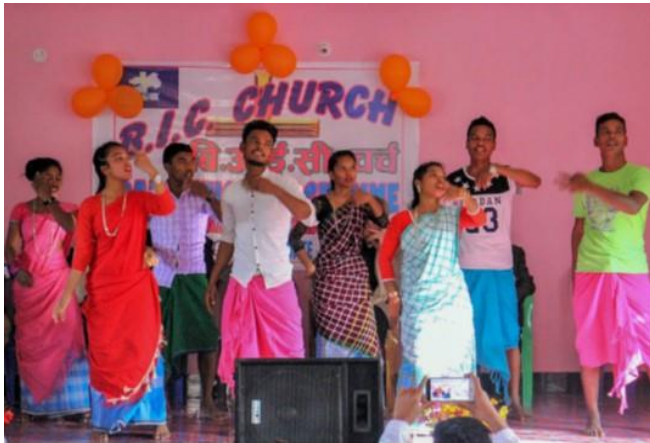
JUNGE TÄNZER IM GOTTESDIENST IN DER BRETHREN IN CHRIST CHURCH IN NEPAL 2018.

Zu dieser Begegnung kommt es, als Jesus durch Samaria reist. Die Leute von Samaria waren Feinde des Volkes Israel. Beide Völker hielten sich für die wahren Erben des Bundes mit Abraham, und beide dachten, dass nur sie Gott auf die rechte Weise anbeteten. Ob in eurer Gemeinde wohl auch schon solche Gedanken geäußert wurden, dass nur eure Art Gott zu dienen die richtige ist?