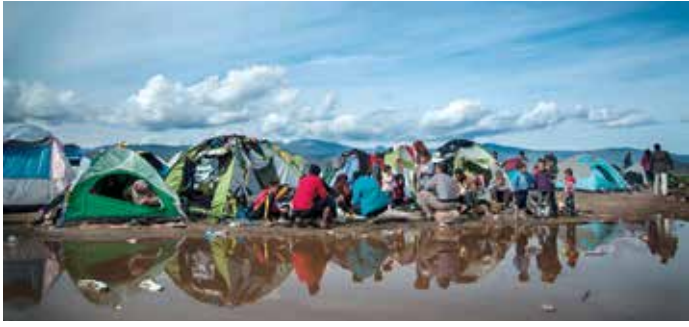
Geflüchtete warten nach ihrer Überfahrt nach Griechenland in Idomeni darauf, die Grenze nach Mazedonien zu überqueren

Abkommens veröffentlicht. Die Vereinbarung entspricht in ihrer Form eher einer Presseerklärung als einem internationalen Abkommen und baut auf vorangegangene, wenig wirksame Rückübernahmeabkommen zwischen der Türkei und der EU auf. Wichtigstes Ziel des Abkommens ist die deutliche Reduzierung von Zuwanderungszahlen. Die türkische Regierung verspricht ihre Grenzüberwachung auszubauen, um Migrantinnen und Migranten an der Grenzüberquerung zu hindern und vermehrt gegen Schlepper-Netzwerke vorzugehen. Die Menschen, die es trotz verschärfter Kontrollen auf die griechischen Inseln schaffen, sollen laut Abkommen nach einem Asylschnellverfahren in die Türkei zurückgeschoben werden. Im Gegenzug verspricht die EU, bis zu 72.000 syrische Staatsbürgerinnen und Staatsbürger aus der Türkei in europäischen Mitgliedstaaten anzusiedeln. Im Rahmen dieses 1:1-Tauschmechanismus soll für jede Person syrischer Staatsbürgerschaft, die in die Türkei abgeschoben wird, eine Syrerin oder ein Syrer in Europa angesiedelt werden. Zusätzlich werden der Türkei Erleichterungen bei der Vergabe von Schengen-Visa an türkische Staatsbürgerinnen und Staatsbürger sowie 6 Milliarden Euro für den Ausbau der Grenzkontrollen und die Versorgung von Geflüchteten versprochen. Außerdem hat man zugesichert, die EU-Beitrittsverhandlungen mit der Türkei wieder aufzunehmen.