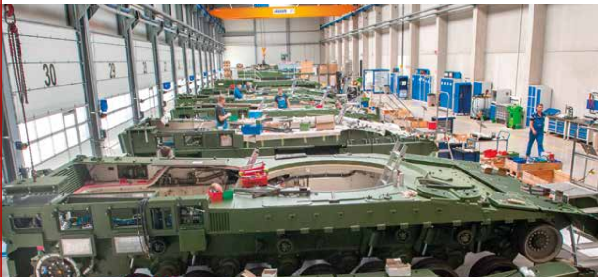
Produktionsstätte des Schützenpanzers Puma der Firma Rheinmetall in Unterlüß, Niedersachsen

Die Europäisierung des Grenzmanagements und der Flüchtlingsabwehr und insbesondere die Bereitschaft zur gemeinschaftlichen Finanzierung von Beschaffungsvorhaben hat das Interesse der (deutschen) Rüstungsunternehmen geweckt. Sie hoffen, bereits eingeführte militärische Systeme und Geräte (z. B.