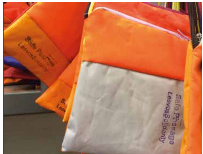
Taschen aus Rettungswesten: Upcycling-Workshop im Mosaik-Center. Zu beziehen über www.lesvossolidarityshop.org

CPT bemüht sich um Inklusivität, Ökumenizität und Diversität als Zeichen der Liebe Gottes in Gemeinschaften. Krieg und Unterdrückung können durch die Kraft der Gewaltfreiheit, durch Partnerschaften mit lokalen Friedensstiftern und mutiges und kreatives Handeln verwandelt werden. Das Motto von CPT ist: »Partnerschaften bilden, um Gewalt und Unterdrückung zu transformieren«. Die Teams verzichten deswegen auf missionarische Tätigkeit und arbeiten kollegial mit muslimischen, jüdischen und säkularen Gruppen zusammen.