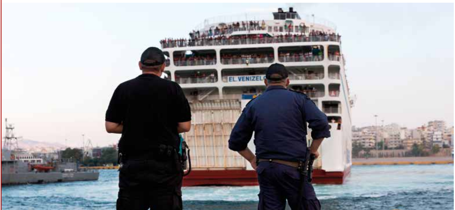
September 2015: Von den Inseln aufs griechische Festland. Noch ist der Weg über die Balkanroute offen.

FRONTEX – seit 2016 offiziell umbenannt in »European Border and Coast Guard Agency« (EBCG) – hat die Fluchtbewegungen Richtung Europa als Argument für den weiteren Ressourcen- und Aufgabenzuwachs genutzt: Zwischen 2006 und 2017 erhöhte sich das Budget von 19,2 auf 280,5 Millionen Euro, das Personal wuchs von 45 auf 541 Personen an. Ende März 2019 beschloss die EU-Kommission die Aufstockung des laufenden Budgets auf insgesamt 1,3 Milliarden Euro 2019/2020. Im darauf folgenden Planungszeitraum (2021–2027) sollen im EU-Finanzrahmenplan insgesamt 11,3 Milliarden Euro für FRONTEX bereitgestellt werden, und die Personalstärke soll auf 1.500 Personen erhöht werden. Außerdem ist geplant, den Personalpool für Interventionseinsätze an den Außengrenzen (inkl. Drittstaaten) – sogenannte Rapid Border Intervention Teams (RABIT) – aufzustocken. Als Teil der »Reliable Intervention Force« sollen 7.000 Grenzbeamte für kurzfristige Einsätze und 1.500 Grenzbeamte für längerfristige Maßnahmen mobilisiert werden können.