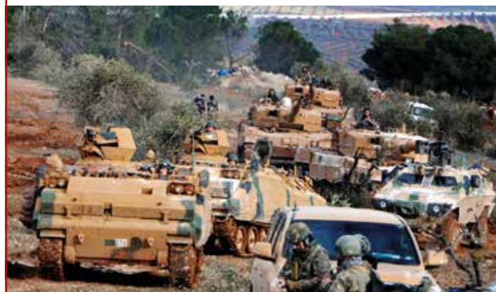
Türkische Truppen besetzen den Bursayah-Hügel, der die kurdische Enklave Afrin von der türkisch kontrollierten Stadt Azaz trennt

Nicht ausgeschlossen werden kann, dass weitere Rüstungsgüter deutschen Ursprungs bei dieser Intervention zum Einsatz kamen. So wäre es unter militärischen Gesichtspunkten durchaus sinnvoll gewesen, wenn die türkische Armee den Vormarsch ihrer Interventionstruppen mit dem deutsch-französischen Artillerieortungsradar Cobra unterstützt hätte, um einen Beschuss ihrer Truppen mit Mörsern rasch und effektiv unterbinden zu können. Die Türkei