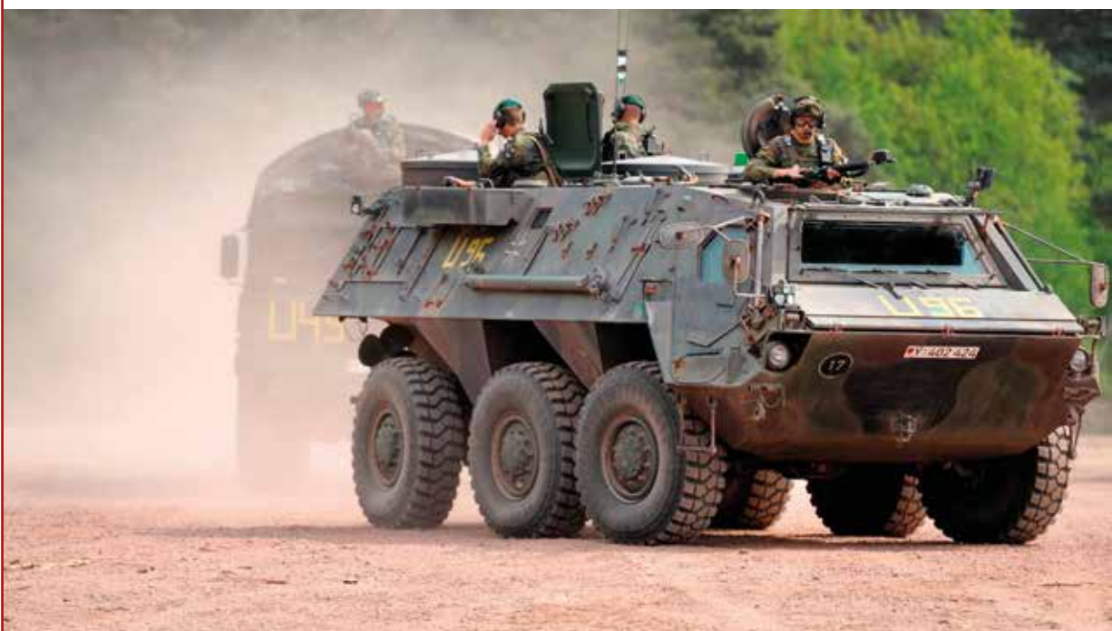
Ein Radpanzer des Typs Fuchs 2, wie er auch von dem Unternehmen Rheinmetall Defence nach Algerien geliefert wurde

Der deutsch-französisch-spanische Rüstungsriese Airbus SE galt bis zum Verkauf der Saparte Airbus Defense & Security (Airbus DS) an die US-Investmentgesellschaft KKR im Jahr 2018 als Big Player im Grenzschutzmarkt. Parallel zum Anstieg der Fluchtbewegungen nach Europa kündigte Bernhard Grewert, Vorstandsvorsitzender der damaligen EADS-Tochter Cassidian im Dezember 2012 eine Reorganisation der Geschäftstätigkeiten an: »Wir werden unser Verteidigungsgeschäft stabilisieren und verstärkt in ausgewählte Sicherheitssegmente wie Grenzschutz- und Kommunikationssysteme investieren.«