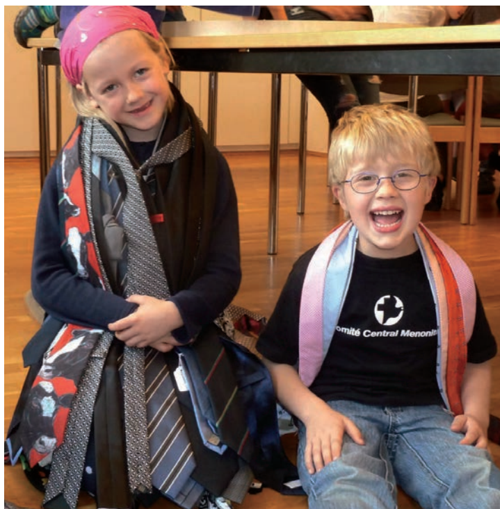
Kinder freuen sich an den Krawatten aus Krefeld, Deutschland, bevor die Krawatten die Reise nach Pennsylvania antreten.